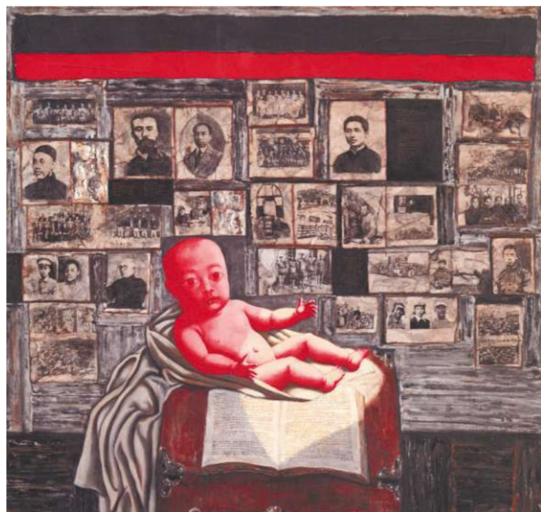
Zhang Xiaogangs Paraphrase auf das neue China und seine Geschichtsgrößen spielte den Rekordpreis von 3 Mill. Dollar ein.

Und auch in der Sparte der altchinesischen Sammelobjekte aus Jade, Rhinozeroshorn, Cloisonné und bei Schnupftabakfläschchen setzte sich asiatische Kaufkraft durch. Pracht aus kaiserlichen Werkstätten trium-