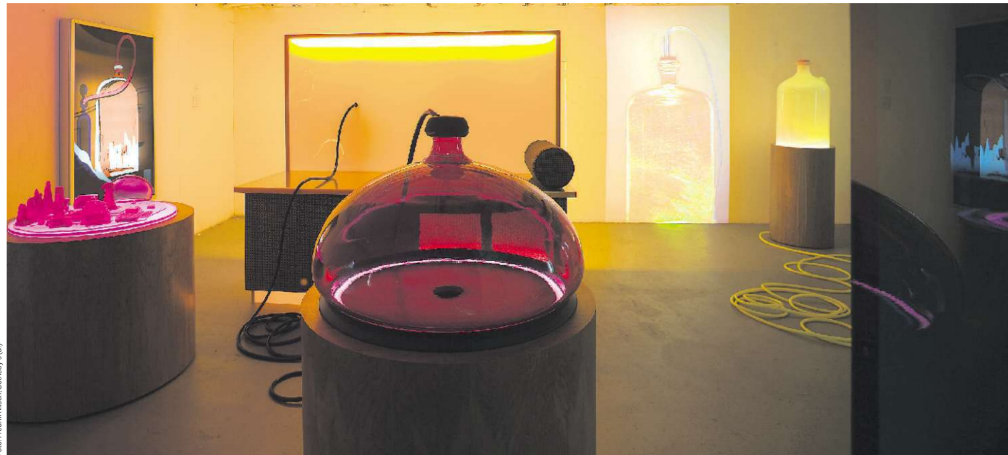
Einen farbenprächtigen Auftritt hat Mike Kelley mit der Installation „Kandors“ in der Galerie Jablonka. Ihr Thema ist die Stadt Supermans, die im Comic-Strip immer in anderer Gestalt erscheint.