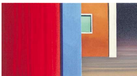
Matthias Kanters Gemälde „Venedig rot blau“ stellt die Galerie Martin Mertens auf der Preview-Messe aus.

Berliner Liste 2007 vom 30.9. - 3.10. im ehemaligen Postgüter- bahnhof Luckenwalder Str. 4/6, 51 Galerien aus 14 Ländern mit Schwer- punkt Osteuropa, www.berliner-liste.org