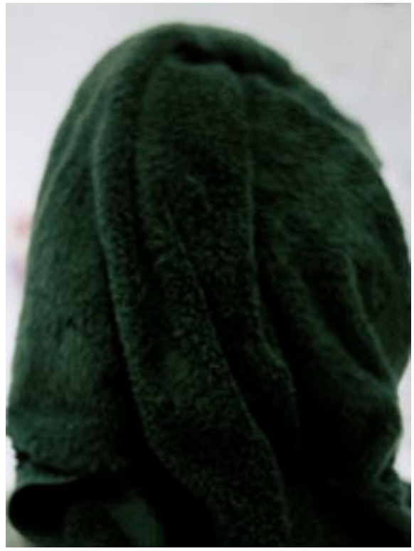
#2, 2006, C-print, 63 x 52,5 cm, ed. 3+1 a.p