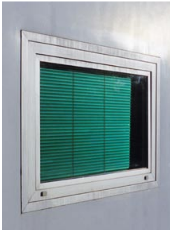
#3, 2006, C-print, 53 x 43 cm, ed. 3+1 a.p