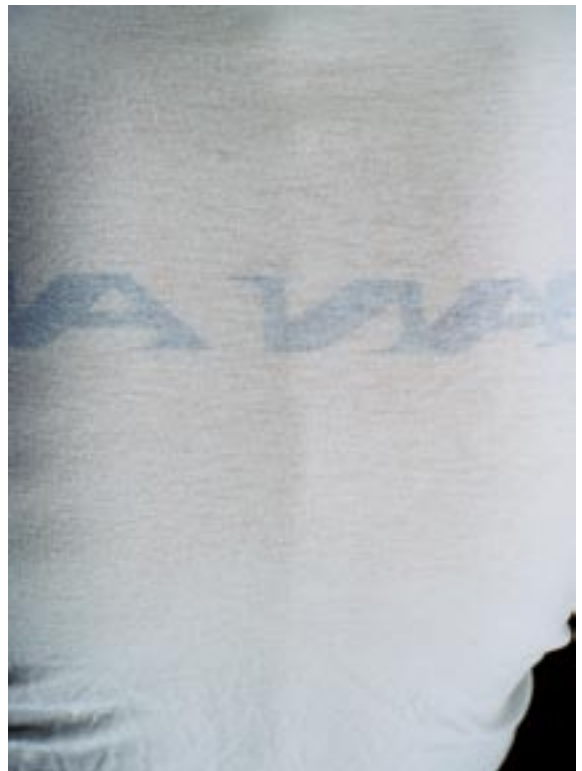
#8, 2006, C-print, 182 x 119 cm, ed. 3+1 a.p