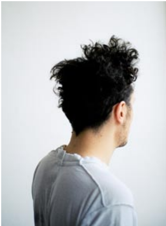
#1, 2006, C-print, 63 x 52,5 cm, ed. 3+1 a.p